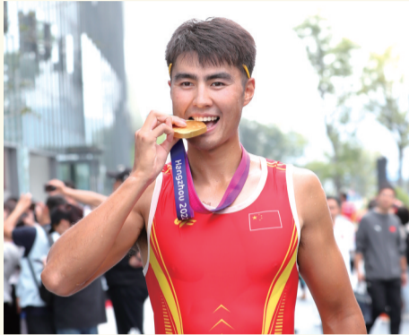
徐桥 赛艇男子八人单桨有舵手