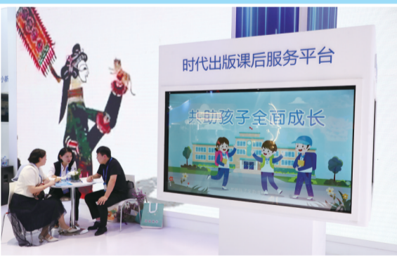
时代出版课后服务平台