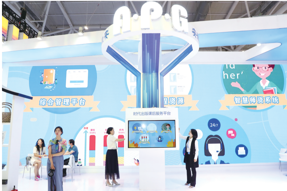
安徽出版集团展厅

值得一提的是,6月7日,光明日报社和经济日报社向社会联合发布了第十五届“全国文化企业30强”名单。其中,安徽有两家企业入榜,时代出版传媒股份有限公司位列其中。