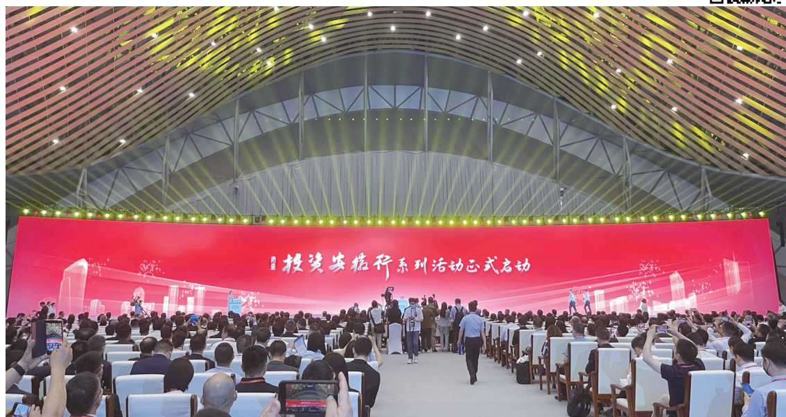
“投资安徽行”系列活动大会现场

5月28日上午，“投资安徽行”系列活动启动大会在合肥举行，启动大会以“投资安徽·与机遇同行”为主题，采取“省主会场+各市分会场”的方式，广泛邀请海内外知名企业、投资机构、创业团队、智库、行业商协会、驻华使领馆商务参赞等走进安徽，深度认识和感知安徽发展的活力和潜力，共享机遇、共谋发展。