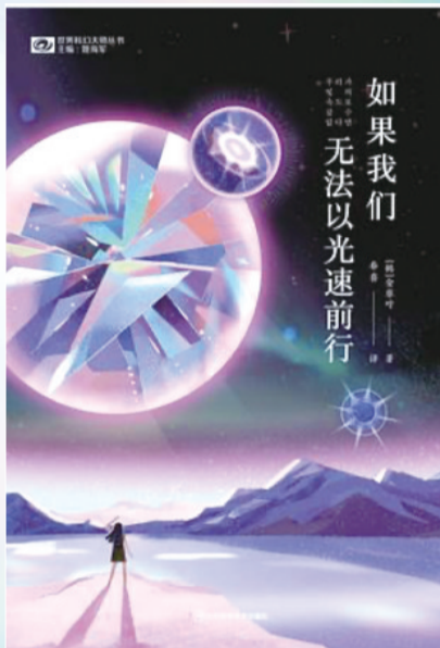
《如果我们无法以光速前行》