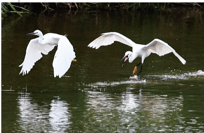
8月27日，白鹭在山东省滕州市的荆河上嬉戏。

毛宁说，网络空间安全威胁是各国面临的共同挑战，维护网络安全是国际社会的共同责任。中国坚持和平利用网络空间，愿同国际社会一道，加强对话与合作，共同反对网络霸权，共同应对各类网络攻击，维护和平、安全、开放、合作、有序的网络空间，推动建立多边、民主、透明的全球互联网治理体系，携手构建网络空间命运共同体。