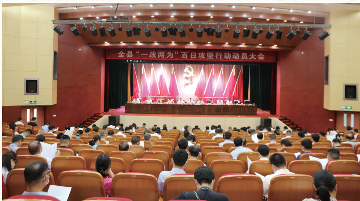
7月10日,全椒县召开“一改两为”百日攻坚行动动员大会