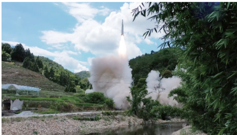
演训现场(组图)