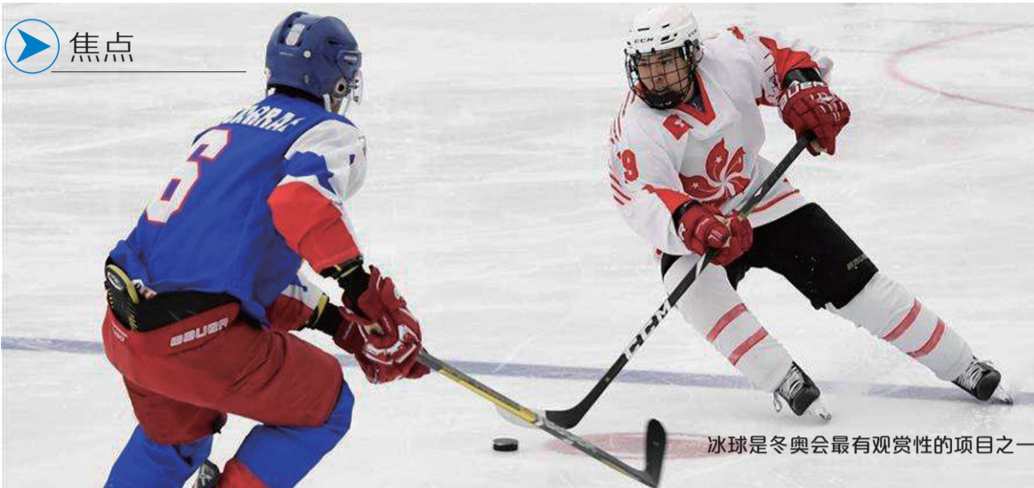
冰球是冬奥会最有观赏性的项目之一