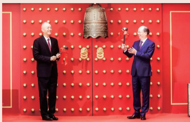
中央政治局委员、北京市委书记蔡奇与中国证监会主席易会满共同为北京证券交易所敲钟开市

大场面,周一,投资者又见证历史了!中国资本市场的发展再现“中国速度”。9月2日,中国官方宣布将设立北交所。如今,时隔仅74天,北交所11月15日正式开始交易。