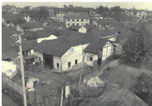
陈延年和陈乔年的故居