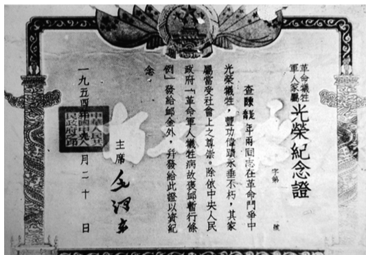
陈延年和陈乔年的烈士证书