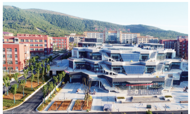
张江萧县高科技园