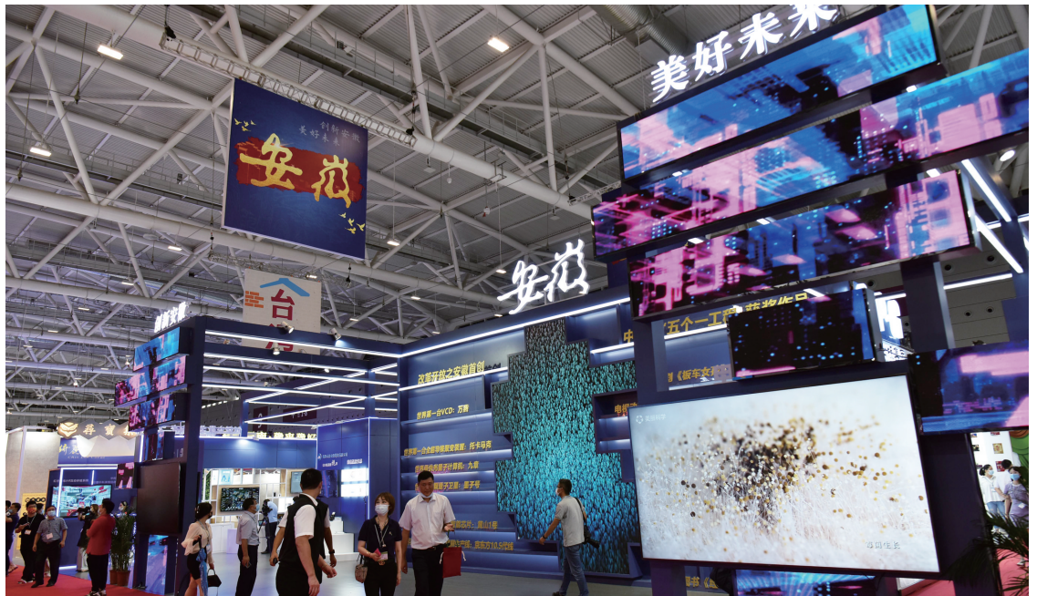
安徽馆吸引了很多观众

此外,安徽国家数字出版基地展馆设在媒体融合·电影工业馆(14号馆),展区面积165平方米,我省组织国家数字出版基地合肥园区、芜湖园区和安徽新华发行(集团)控股有限公司、时代出版传媒股份有限公司、黄山书社等领军单位参展。