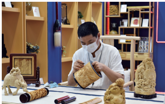
徽州竹雕现场展示