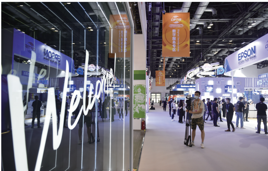
8月31日,媒体记者在国家会议中心展馆内探访。■ 新华社记者 鲁鹏/摄