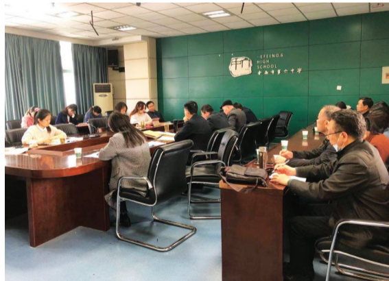
合肥六中总校与瑶海分校开展一体化教研

放眼未来,合肥六中教育集团瑶海分校将不断求索,与时俱进,信心百倍地奔跑在教育改革的道路上,