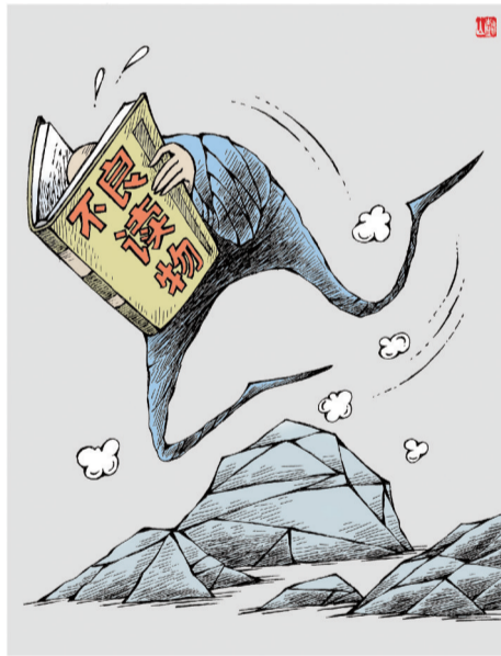
失足 ■ 杨树山