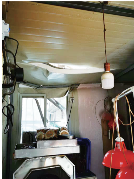
炒货铺的泡沫棚顶疑似被砸凹陷

3月29日上午，合肥市庐阳区宿州路省医老院宿舍小区内，祖孙二人相继从6楼阳台不慎坠落。市场星报、掌上安徽、安徽财经网(www.ahcaijing.com)记者了解到，目前，两人均在中国科学技术大学附属第一医院内接受治疗。 ■ 本报记者