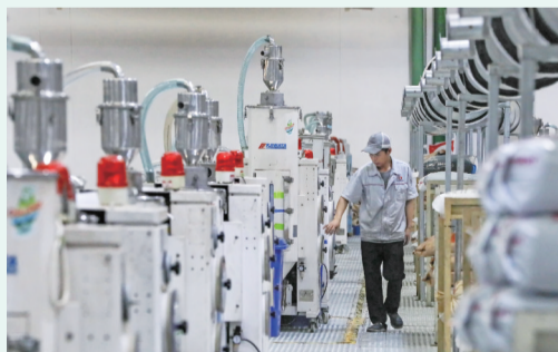
欣阳精密科技(滁州)有限公司