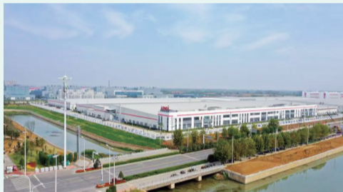
滁州隆基乐叶光伏科技有限公司

大招商带来大发展，作为滁州市唯一的国家级经开区，滁州经开区成立28年来一步步跨越发展，综合实力已位居安徽省内开发区第一方阵。滁州经开区已形成了以智能家电及电子信息、汽车及先进装备制造、绿色食品产业为主导，以新能源、新材料等新兴产业为补充的多元发展、多极支撑的综合产业体系。特别是智能家电基地，在库规模以上工业企业102家，2019年基地产值总量首次跃上500亿元台阶。