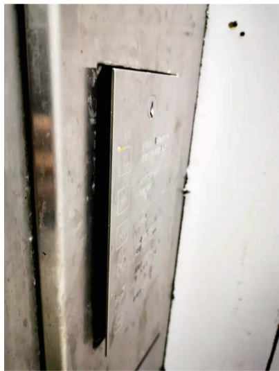
按钮下方带锁孔的盒子未关严