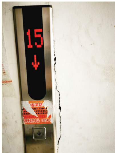
电梯按键旁的裂缝

随后,记者在10栋居民楼内发现,电梯被关停。电梯门上还贴有“请勿乘坐电梯”的标识。