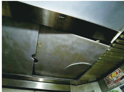
未固定的电梯厢板