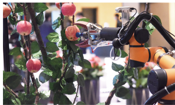
一台苹果采摘机器人在成果展示现场演示