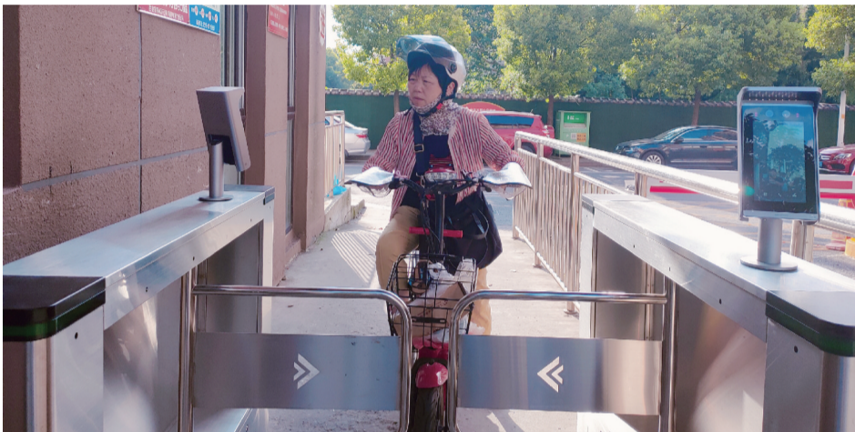
在江苏省南通市崇川区学田街道，小区居民通过人脸识别设备经过小区的出入口