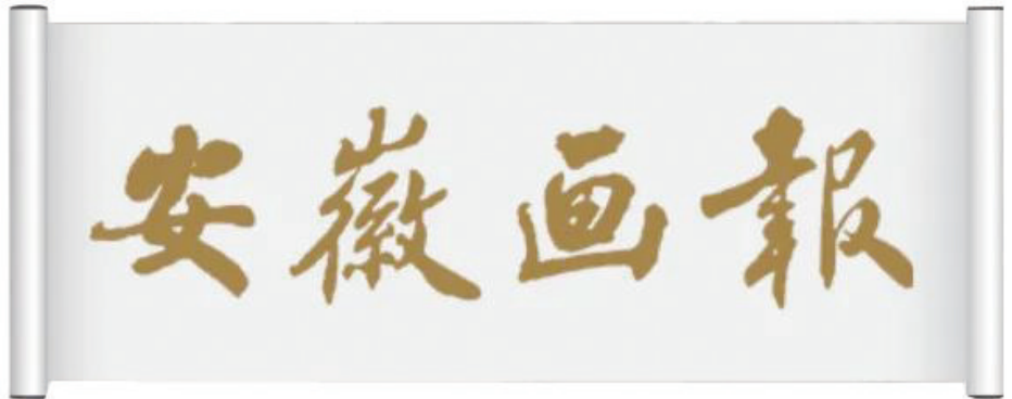
朴老题写“安徽画报”