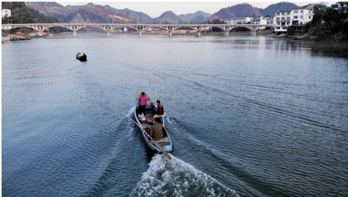
无人机拍摄的新安江渔民

“改革加快动力变革,促进效率变革,实现质量变革,极大地激发了全社会创新活力,提升了创新主体获得感,促进了科技创新和实体经济的融合发展,创新对经济社会发展的支撑和引领作用进一步显现。”省发展改革委相关负责人表示,今年,我省上报的建立基于大数据分析的“银行+征信+担保”的中小企业信用贷款新模式、地方深度参与国家基础研究和应用基础研究的投入机制2项改革举措被国务院在全国推广。至此,我省累计有13项改革举措被国务院列入全国推广改革经验。