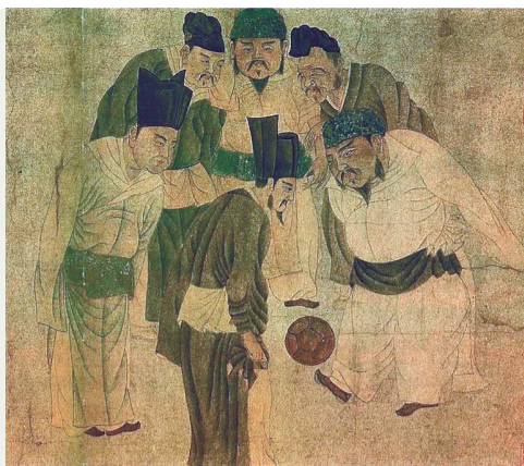
宋人的假期休闲娱乐活动多姿多彩。图为《宋太祖蹴鞠图》。