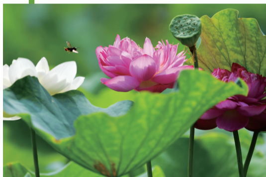
6月21日,在福州茶亭公园荷花塘里,荷花盛开。

据新华社电(记者 周润健)“星繁愁昼热,露重觉荷香。”《中国天文年历》显示,北京时间6月21日5时44分迎来“夏至”节气。此时节,荷花别样红,蝉鸣声声响。