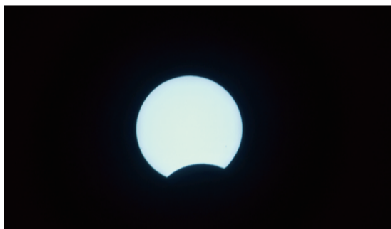
这是6月21日在北京拍摄的日食