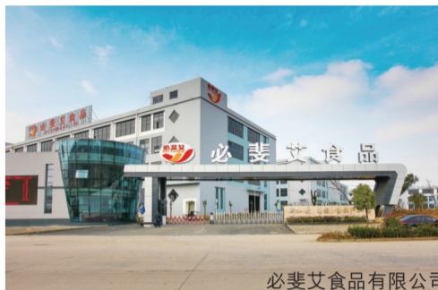
必斐艾食品有限公司

对于政策等很多方面,企业不明白,舒城经开区悉心指导,感觉到很“亲商”,后期还介绍了其他很多外资企业过来,泰森食品、嘉吉食品、食为天等项目落地,是看到必斐艾在这边发展得很好,可以自豪地讲“原来中国有个舒城,因为必斐艾在这里。”