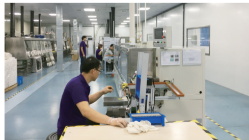
绿沃循环能源生产车间

从实体产品到公共服务平台,绿沃产品包括低速电动车电池系统、储能电池系统和大数据公共服务。为满足客户需求,公司已租赁厂房先期生产,2020年以来已完成产值1.5亿元,计划全年实现年