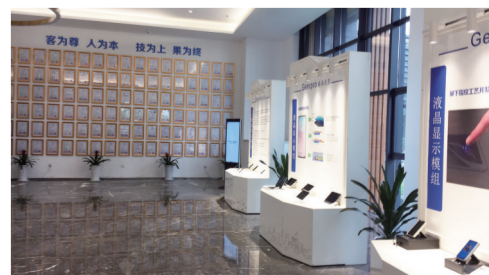
精卓光显展示大厅

项目全面建成后,力争在3年内成为全国第一、全球领先的显示触控模组及5G智能终端研发制造基地。