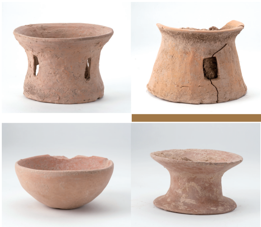
仰韶早期器物(资料照片)