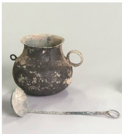
发掘出土的铜釜与铜勺