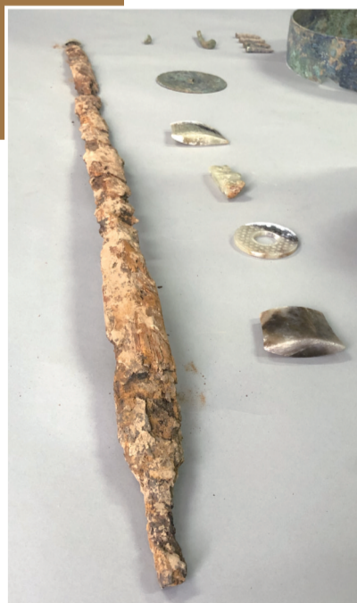
发掘出土的铁剑与玉器等