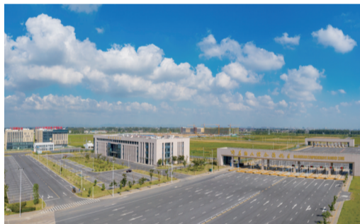
马鞍山综合保税区(航拍)