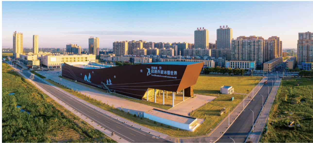
郑蒲港新区核心区

生产机器轰鸣运转，货运车辆来回穿梭，项目抢工如火如荼，忙碌的身影随处可见……4月22日，随着疫情的阴霾散去，马鞍山市郑蒲港新区已然从当初复工复产时“动起来”转变为抢工抢产“热起来”，一幅战“疫”和发展双赢的别样“春意图”正在这里铺陈开来。