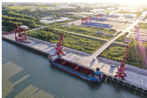
郑蒲港一期码头(航拍)