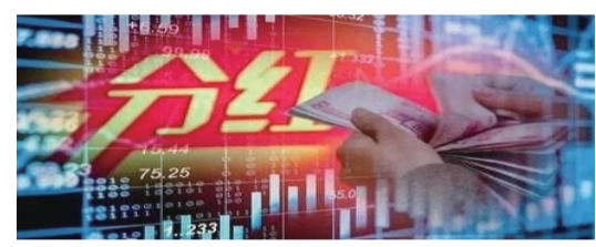
中国神华、中国平安、中国石化和中国人寿现金分红金额也超200亿元。

分红是上市公司回报投资者的一种重要方式,现金分红制度亦是资本市场的一项基础性制度。近年来,随着监管层多项举措的积极引导,上市公司分红率逐步提升。 据统计,截至4月2日,有711家上市公司披露了2019年年报,其中575家上市公司披露了分红预案,其中4家仅高送转,571家分红计划包含现金分红,合计分红金额约7610亿元。 以4月2日收盘价来计算,上述571家公司中,有101家股息率超过3%,31家股息率超过5%,南钢股份以9.68%的股息率位居首位。 从分红金额来看,有18家上市公司分红金额超过百亿元,10家超过200亿元。其中,中行、农行、工行、建行、交行和招行6家银行合计分红约3472亿元。另外,