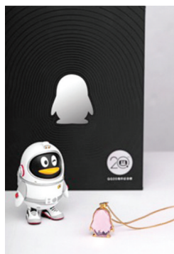
本礼盒包含金沙企鹅、316L项链、时尚皮绳,以及QQ20周年太空鹅纪念版公仔,售价为588元