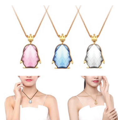
产品配有316L项链和时尚皮绳,兼顾你不同场合不同心情的佩戴方式。

企鹅造型正面采用菱形切面人造水晶,阳光照耀下更为璀璨闪烁,并配有白色的“纯洁之光”、蓝色的“无畏之心”和粉色的“甜蜜之恋”三个款式,象征着不同的情感意义。