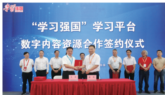
“学习强国”学习平台数字内容资源合作签约仪式现场