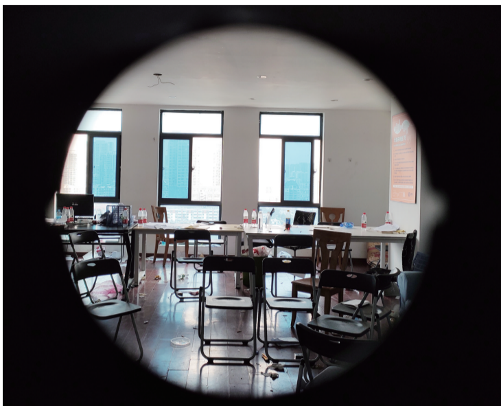
7月19日，乐伽华府骏苑办事点