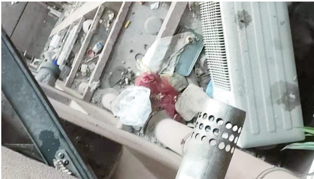
博澳丽苑的高空抛物布满了平台