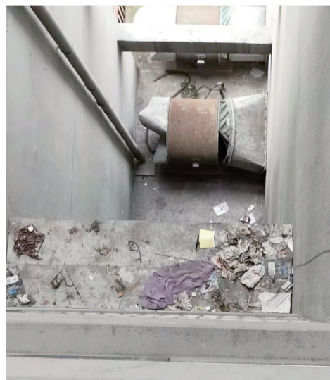
百汇城市广场一处平台上的抛弃物