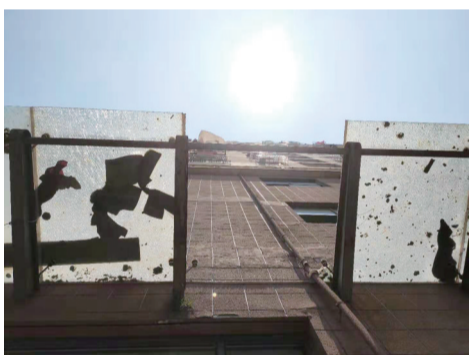
海雨家园的玻璃挡板缺失一块