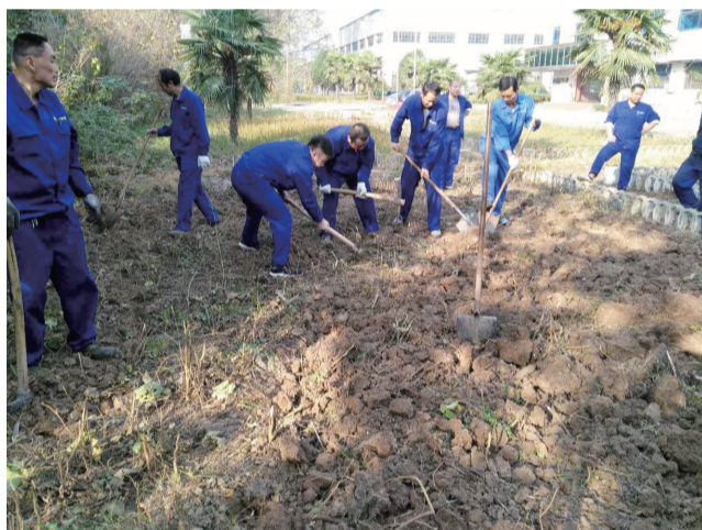
党员服务队队员美化厂区环境