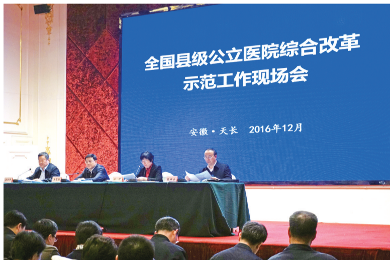
全国县级公立医院综合改革示范工作现场会