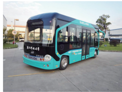
新能源智能公交——安凯无人驾驶汽车