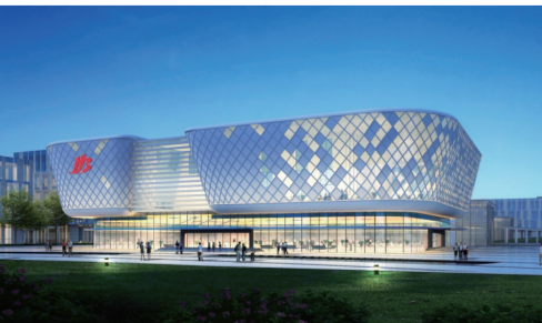
智汇工业园展览馆

中国进出口银行，3年内累计向安徽开发区及企业提供不低于100亿元人民币的金融支持；“培训进园区”活动，将针对开发区不同的问题，邀请全国相关领域的专家进行讲课培训；“外商进园区”将根据开发区主导产业和重点方向，邀请世界500强企业到开发区考察对接；“非公党建进园区”将由安徽省商务厅每年组织全省非公党建现场会，提升精气神；“精准服务进园区”将针对开发区考核中的不足展开帮扶。今年安徽省商务厅还将开展全省开发区庆祝新中国成立70周年的系列宣传活动，希望包河经济开发区积极申请，加强对接。