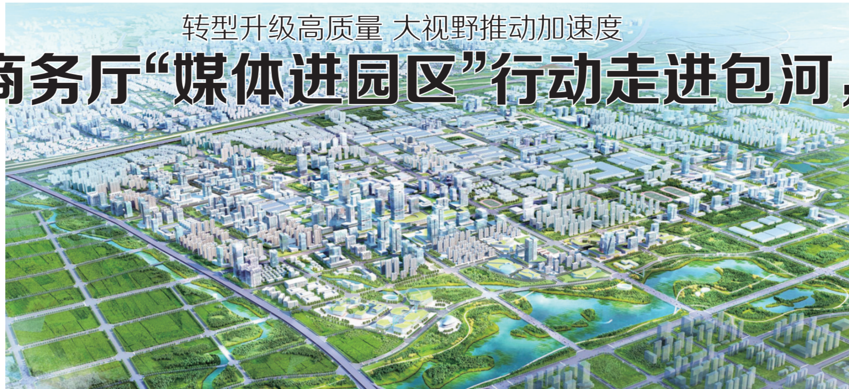
包河经开区鸟瞰图