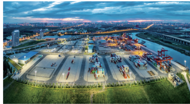
合肥港国际集装箱码头