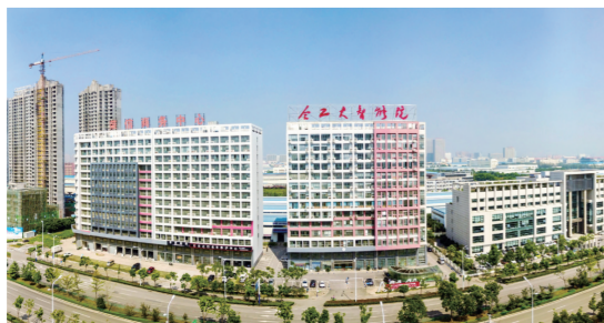
合工大智能研究院落户包河