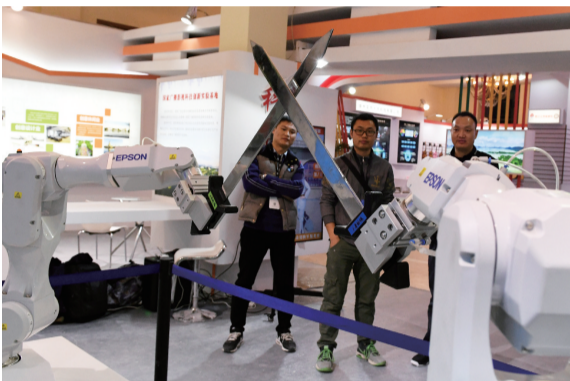
合肥展区的工作人员正在调试“舞剑”机器人

11月28日下午,沪苏浙皖三省一市党委宣传部及上海市国际贸易促进委员会举办首届长三角国际文化产业博览会新闻发布会,正式宣布首届长三角文博会将于11月29日至12月2日在上海举办。