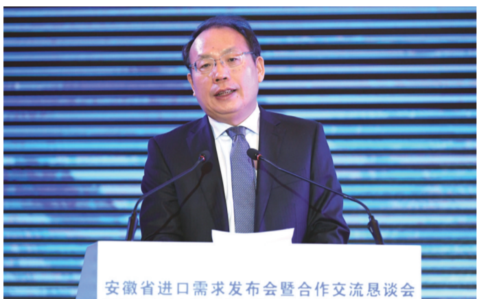
副省长周喜安出席并致辞

副省长周喜安出席并致辞。他表示,积极扩大进口是安徽参与国际分工的重要途径和开放合作发展的坚定方向。多年来,安徽出台多项政策,促进进口稳步增长,去年全省进口231.5亿美元,增长45%,今年1~9月进口204.2亿美元,同比增长21.8%。今后一个时期全省每年进口额将继续保持较快速增长的态势。