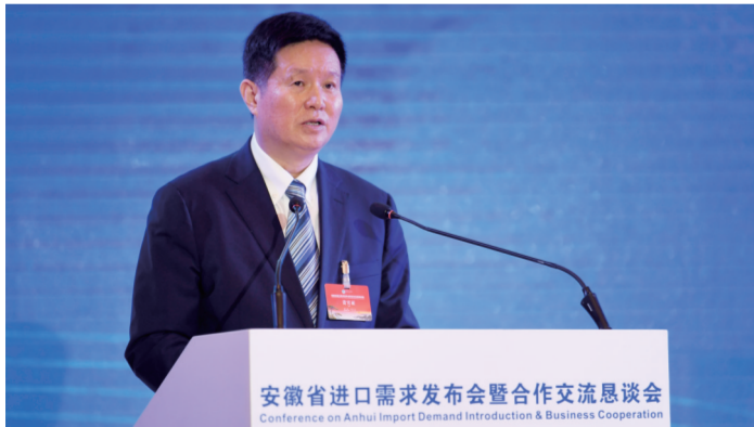
省商务厅厅长张箭发言