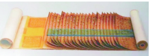
唐代龙鳞装《刊谬补缺切韵》,现藏于北京故宫博物院