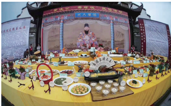
“祭汪公——赛琼碗”民俗活动

在规模最大的祭祀活动中,案桌上最多排放24行,每行12盘(碗),总计多达288盘(碗)供奉。这些表达百姓对神灵顶礼膜拜而精心制作的珍馐供品,宛如一件件艺术精品,不仅美味而且赏心悦目。从唐代