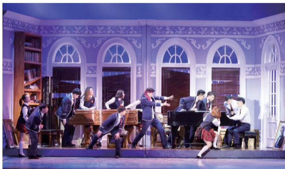
时间:11月3日 15:00 地点:安徽大剧院

许多粉丝纷纷表示,“这是一张欠了周杰伦十年的电影票”。剧中不仅保留了电影版《不能说的秘密》中躲雨、斗琴等经典桥段,还增加了许多更适合在音乐剧舞台上展示的幽默细节,足以见得整个主创团队的创意和对这部音乐剧的用心。