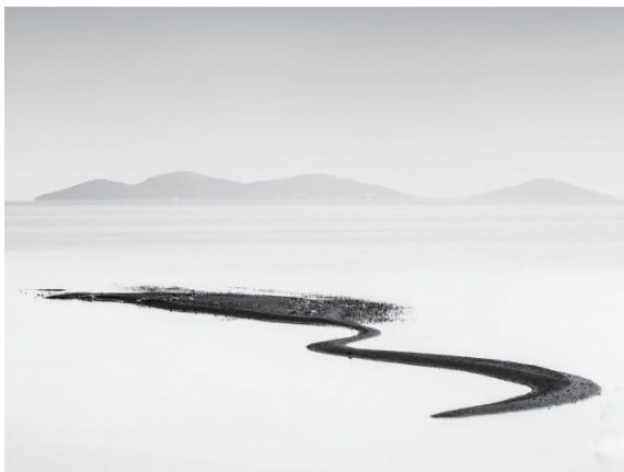
景观类冠军：沙的形状