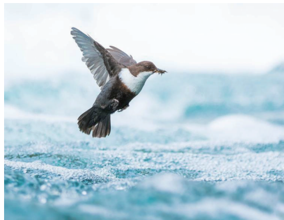
15-17岁青少年摄影师奖：飞翔的河乌