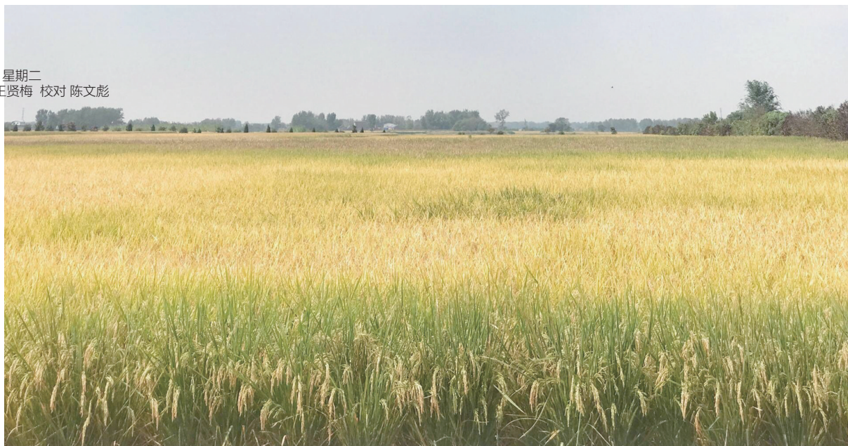
小岗村现代农业示范区水稻长势喜人

一片片农田、果园生机勃勃，一条条农产品深加工生产线蓄势待发，一处处景点、农家乐热闹非凡……改革开放40年来，小岗村聚焦现代农业、农产品深加工、红色旅游三大主导产业，推动一二三产融合发展，全力打造小岗村三产融合新样板。 □ 记者 徐越蕾 文/图