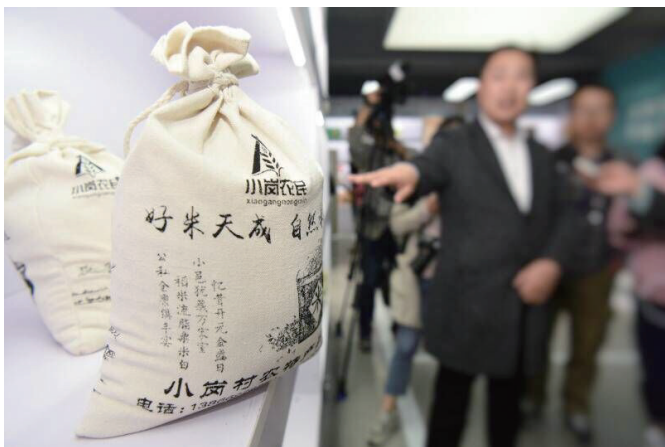
在凤阳小岗科技有限公司“互联网+大包干”体验中心，摆放着“小岗农民”原生态大米