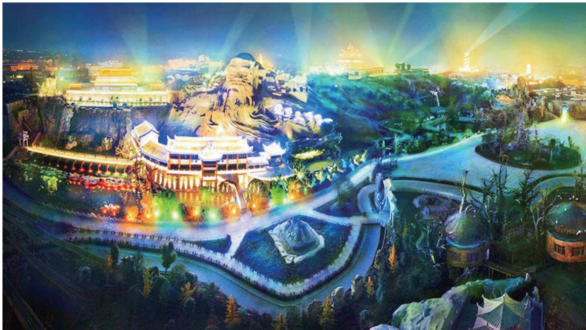
五千年文博园夜景