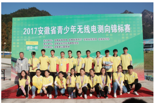
参加省青少年无限电测向锦标赛并获奖