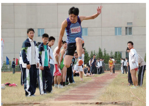
十一中学子运动会赛场上奋力拼搏