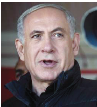
内塔尼亚胡：伊朗撒谎

综合报道，在美国正要为是否退出伊朗核问题协议作出决定前，以色列突然公布所谓德黑兰政府试图研发核武器的“证据”。但欧盟外交和安全政策高级代表莫盖里尼并不接受这一说法。 ■ 据中新社