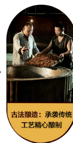
古法酿造: 承袭传统工艺精心酿制