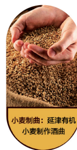
小麦制曲: 延津有机小麦制作酒曲