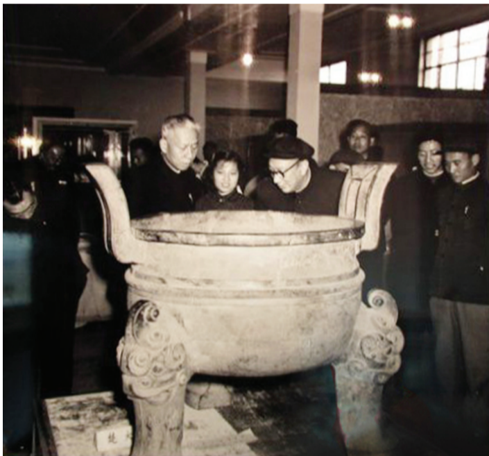
刘少奇同志参观楚大鼎