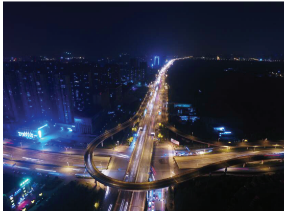
马鞍山路与繁华大道交口