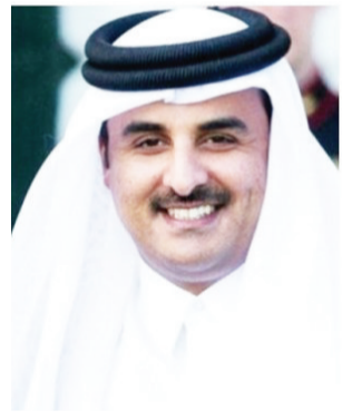
卡塔尔国家元首塔米姆