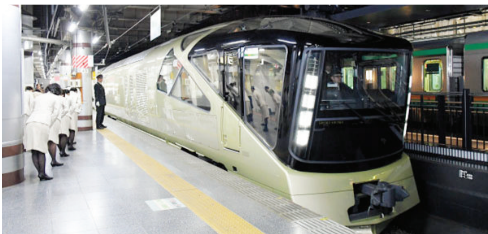
“四季岛”豪华观光列车