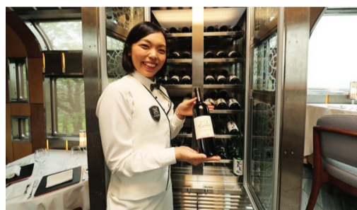
列车餐厅内备有各种红酒