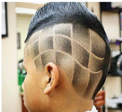
学画画出身的理发师就是任性