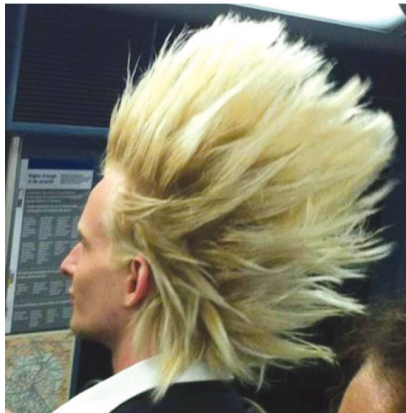
风刮的越大,发型越帅气