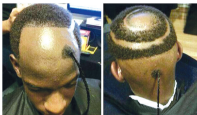
前后各一缕头发,有始有终